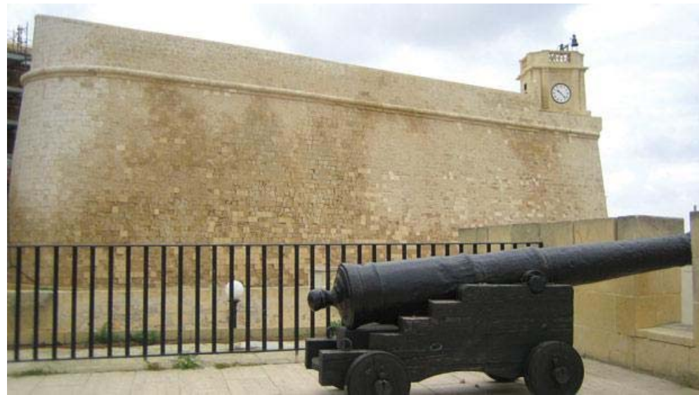
The newly restored St John's Cavalier in the Citadel, Victoria.

The cultural heritage NGO Wirt Għawdex has often urged the government to restore the ridge of St John's Cavalier, along the walls of the Citadel in Victoria, especially since some stone blocks were in danger of collapsing, posing a serious danger to people visiting the area.